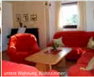
untere Wohnung, Wohnzimmer