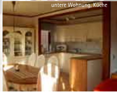
untere Wohnung, Küche