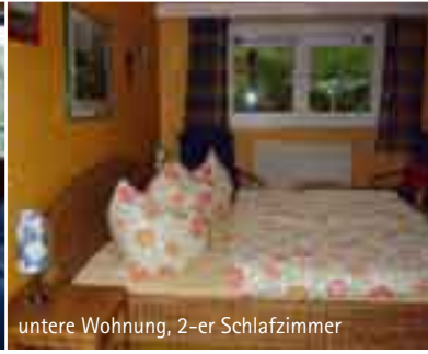
untere Wohnung, 2-er Schlafzimmer