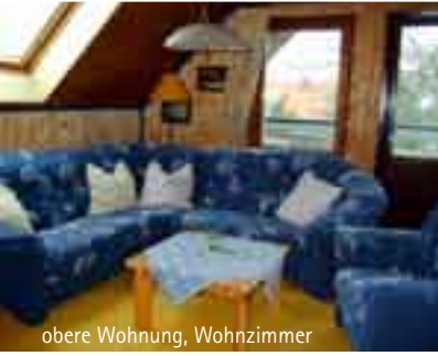
obere Wohnung, Wohnzimmer