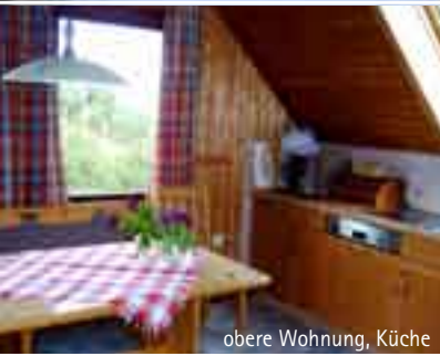
obere Wohnung, Küche