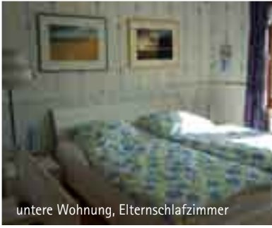
untere Wohnung, Elternschlafzimmer