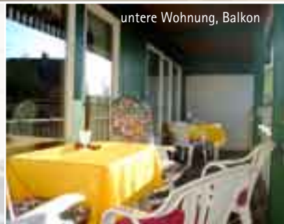
untere Wohnung, Balkon

Haustiere sind nicht erlaubt und in den Wohnungen darf nicht geraucht werden. Kinder sind uns sehr willkommen. Beide Wohnungen haben Telefon und Internetanschluss.