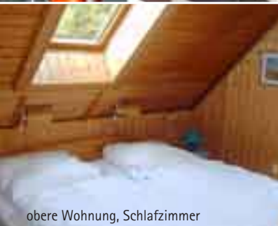
obere Wohnung, Schlafzimmer