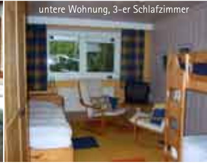
untere Wohnung, 3-er Schlafzimmer

Die obere Ferienwohnung ist ca. 60m 2 groß und ist für 2-4 Personen geeignet.