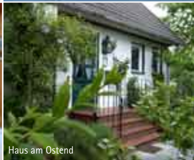
Haus am Ostend

Das „Haus am Ostend“ auf Spiekeroog ist in ruhiger Lage am östlichen Ende des Dorfes auf einem 600m 2 großen bewachsenen Grundstück gelegen. Die Entfernung zum Ortszentrum beträgt ca. 7 Minuten, zum Hafen 15 Minuten und zum Strand 20 Minuten.